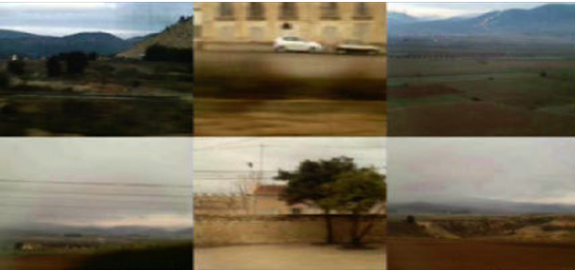
Detalles del vídeo con imágenes grabadas con el móvil en distintos viajes